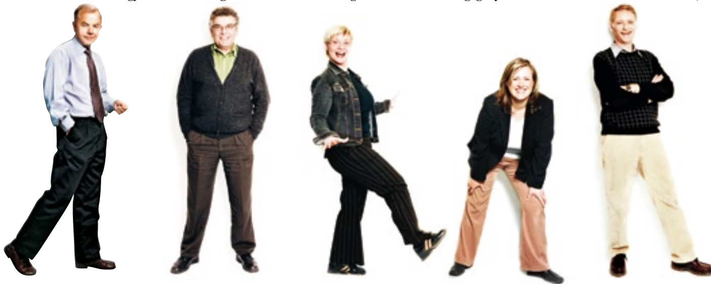
Mesterbrevnemnda, Oslo, 1. mars 2006

Behandlingsgebyret for søknader om mesterbrev var 420,-.