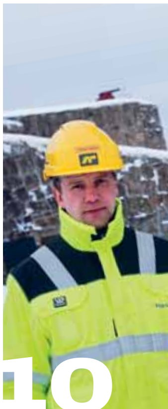
10 Reparerer festningsmurene