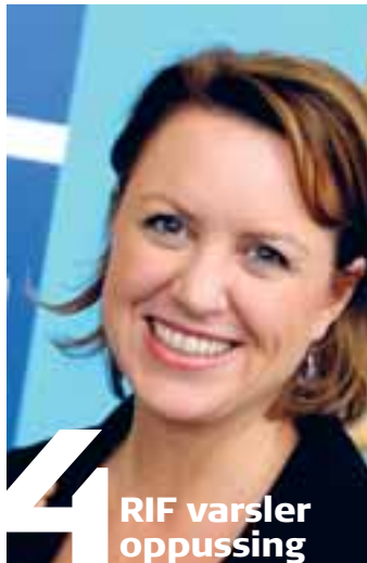
4 RIF varsler oppussing