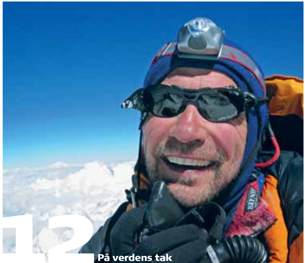
12 På verdens tak