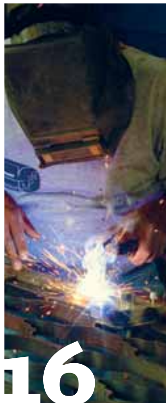
16 Meksikansk smedgnist