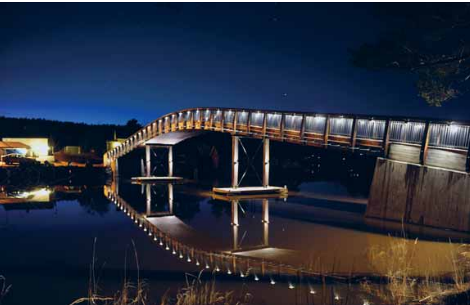
Brua til Mosebyneset tar seg vakkert ut i kveldslys. Den er prosjektert og bygget av Tommy Rambøl i samarbeid med Moelven.